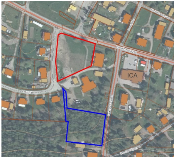
Figur 1: Översikt över de två områden som är aktuella för lekplats

De två områdena redovisas i bild nedan. Området som föreslagits som investeringsprojekt redovisas i rött nedan och det alternativa område som föreslås redovisas i blått.