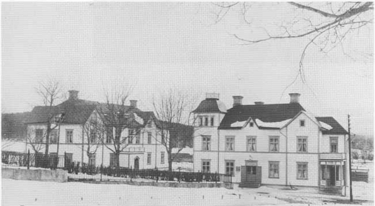
Handlare Norells byggnader, t.v. Blå salongen.