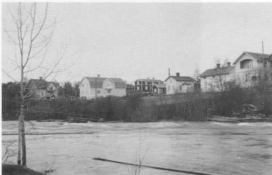
Vy över gårdar i Västanå samlade kring vägen mot Edsbyn. Foto från 1926.

Utbyggnaden var dock snabbare i utkanterna av byn, där många egna hem byggdes under 1900-talets första årtionden. Återigen var det främst Born och Västanå som drog till sig nybebyggelse. På Born trängdes bebyggelsen ihop på små tomter till synes utan någon egentlig planering av områdets utbyggnad. I Västanå och andra områden var tomterna större, och här var omfattningen av egnahemsbebyggelsen även mindre. Egnahemsbyggandet underlättades och uppmuntrades från 1919 då kommunen tillsatte en särskild kommitté för förmedling av egnahemslån.