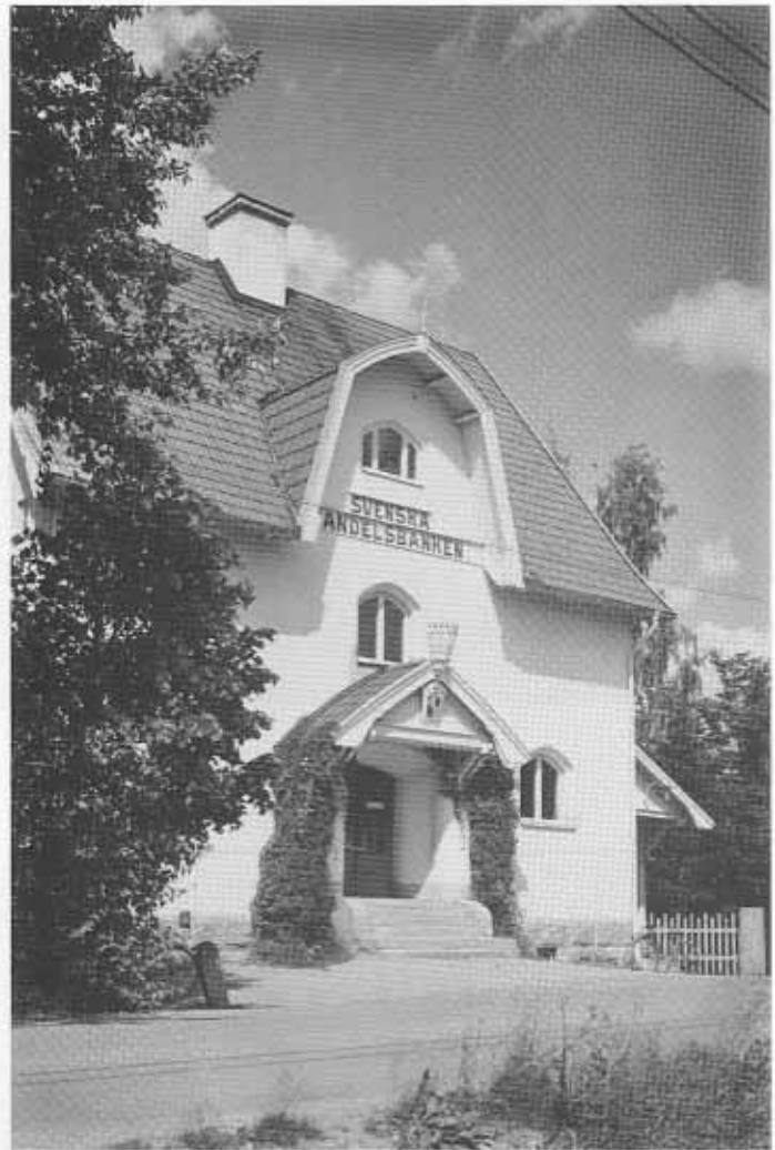
Entrefasaden mot söder på Handelsbankens hus, tidigare Helsinglands enskilda bank. Foto från 1926.