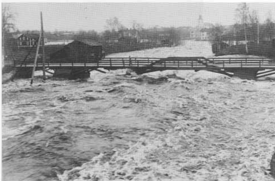
Bron över Voxnan vid Västanå 1926. Denna bro hade ett annat läge väster om gården Knagga än den nuvarande bron som byggdes 1936. Till vänster syns gården Lärka.