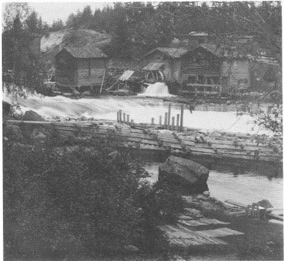
Vattenverk vid Alftaströmmen.

Alfta Elektriska AB drev detta mellan åren 1910-1945 samt även en kvarn. Byggnaderna (Alfta Kyrkbyn 30:57) kvarstår alltjämt.